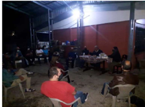
Anexo de visita